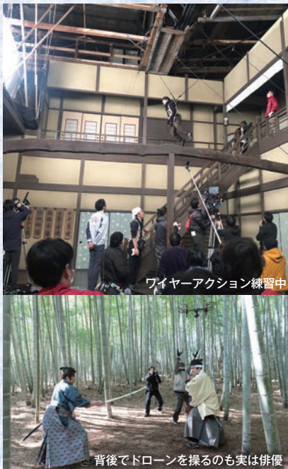
ワイヤーアクション練習中

撮影はあの「蒲田行進曲」が撮られた東映京都撮影所で行われました。かつて日本人が大熱狂した時代劇がまだかつてない映像で蘇ります。お楽しみに！