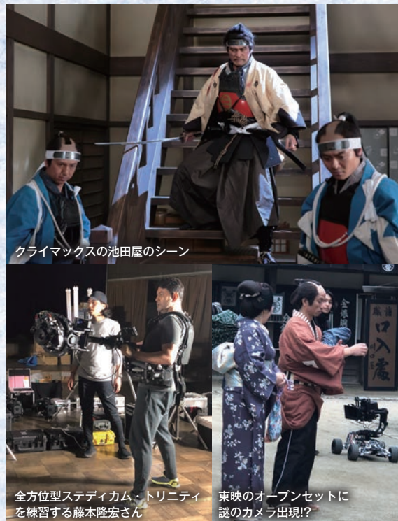
クライマックスの池田屋のシーン