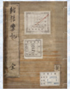
「新猿楽記」国立公文書館蔵

2020年春、優れた文化を創造し続ける文化都市・京都において、芸・産学官が連携して「アート×サイエンス・テクノロジー」をテーマとして文化芸術の新たな可能性と価値を世界に問う新しい形態の国際的な文化・芸術の祭典が開催されます。そのプレ事業として本年3月には、「KYOTO STEAM-世界文化交流祭- prologue」を開催します。会場はロームシアター京都や二条城など。春の京都で開かれる新たな文化の祭典をお楽しみください。