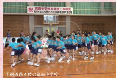
予選通過 4位の筑南小学校