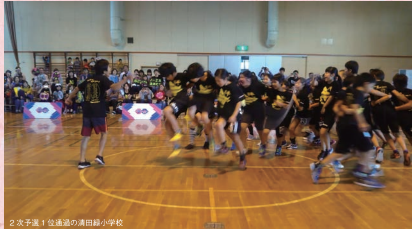
2次予選 1位通過の清田緑小学校

【HP】 http://www.nhk.or.jp/school/nawatobi/